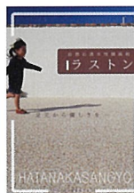
自然石透水性舗装材 ラストン