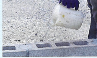
ブロックの中に200ccの水を入れます。