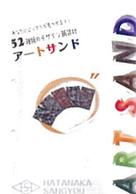
52色デザイン舗装材 アートサンド