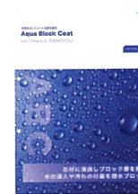
浸透性コンクリート表層保護剤 Aqua Block Coat