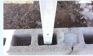
気温20℃の場合で5~6分で固定。3~4時間後、フェンス取り付け可能です。表面仕上げは普通モルタルでコテ仕上げしてください。