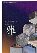
目詰め工法舗装材 雅