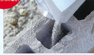
パットカタマル約500gを水を入れた上から直接投入します。(練り混ぜ不要)