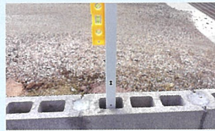
水準器で垂直になるよう調整します。